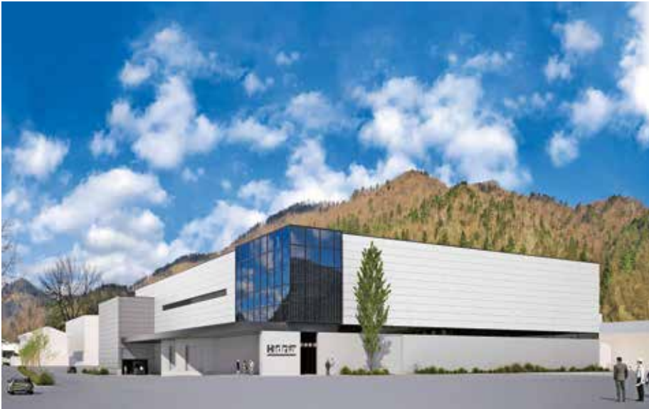
Novi visokotehnološki center električne mobilnosti v Spodnji Idriji

in jih naši zaposleni tudi živijo. Takšnih sodelavcev bi si želeli tudi v prihodnje. Mi jim ponujamo konkurenčni sistem nagrajevanja in višje plače, kot so določene v panožni kolektivni pogodbi. Izplačujemo tudi regres, ki je visoko nad minimalnim, prav tako pa tudi božičnico oziroma izplačilo poslovne uspešnosti. Velik poudarek