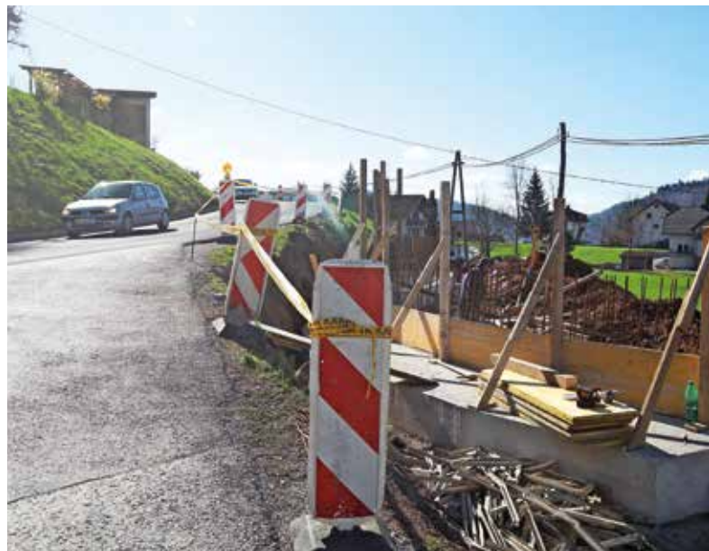
Gradnja pločnikov na Selu

Za obvoznico proti Logatcu pa od države v prihodnjih dneh pričakujejo tehnični pregled in s tem sprostitev prometa po že zgrajeni cesti. V sklopu 2,2 milijona evrov vredne naložbe so poleg novega cestnega odseka v dolžini osemsto metrov in novega krožišča pri Pustotniku pridobili tudi nove pločnike in kolesarsko stezo. »Ko bo promet preusmerjen na obvoznico, bo imela Logaška cesta status občinske ceste, in ne več državne. Obenem bo ta cesta po novem prometno manj obremenjena, kar je še zlasti pomembna pridobitev, saj bo kakovost življenja ob njej zdaj bistveno višja,« je poudaril župan. Boljše prometne razmere se obetajo tudi na Selu, kjer bodo nadaljevali obnovo državne ceste in gradnjo pločnikov ob njej, z izvajalcem pa se po županovih besedah poskušajo dogovoriti tudi za vgradnjo cevi za optično omrežje. »Pogodba je že podpisana, in če bodo okoliščine dopuščale, bo cesta zgrajena še letos.« Občina bo za omenjeni projekt zagotovila 170 tisoč evrov. »Najpomembnejše je, da se uredi križišče proti Jarčji Dolini, ki je ta čas zelo nevarno, in seveda zgradijo pločniki za varnejšo pot pešcev,« je še dodal župan.