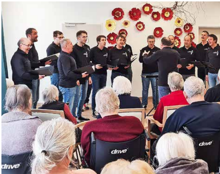
Ob dnevu žena so tako stanovalce kot zaposlene doma SeneCura Žiri razveselili člani Moškega pevskega zbora Alpina Žiri.

Seveda pa na tako lep praznik nismo pozabili na drobno presenečenje za vse stanovalke. Obdarili smo jih z ročno izdelanimi vrtnicami, ki so nastale izpod spretnih rok naših stanovalcev in stanovalk. Stanovalkam je tako vrtnico izročil kar naš stanovalec. Ob tej priložnosti se iskreno zahvaljujemo članom Moškega pevskega zbora Alpina Žiri. Naj njihova ljubezen do glasbe traja in naj velja, kot smo dejali na našem skupnem srečanju: Pridite še kdaj, veseli vas bomo!