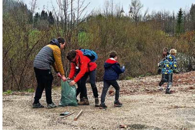
Prostovoljci so tudi letos Žiri očistili smeti.